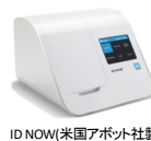
ID NOW(米国アボット社製)

私たちは“コロナ迅速PCR検査”を2台備え、積極的にコロナ診療を行っています。電話予約制ですので、事前に診療所にお電話を下さい。